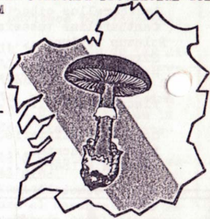
Anagrama de la Federación Galega de Micología.