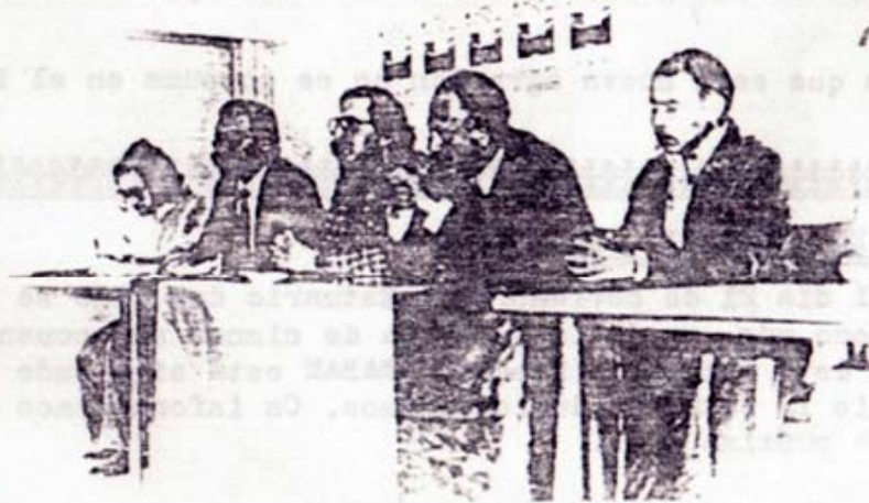
Mesa presidencial el día de la apertura de las Jornadas.

Se han presentado en total 17 ponencias de diferentes Zonas de la Península, presentadas por varios especialistas concedores de las mismas. Al final se redactaron las conclusiones pertinentes.