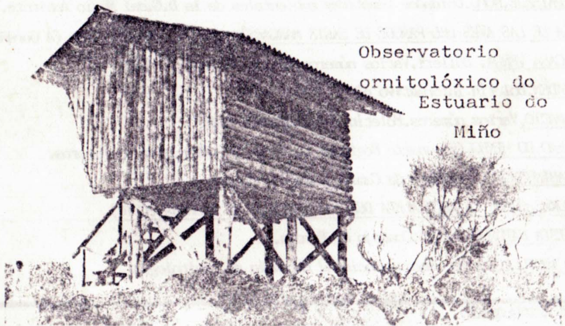
Observatorio ornitológico do Estuario do Miño

Asociación Naturalista "Bajo Miño" - Anabam