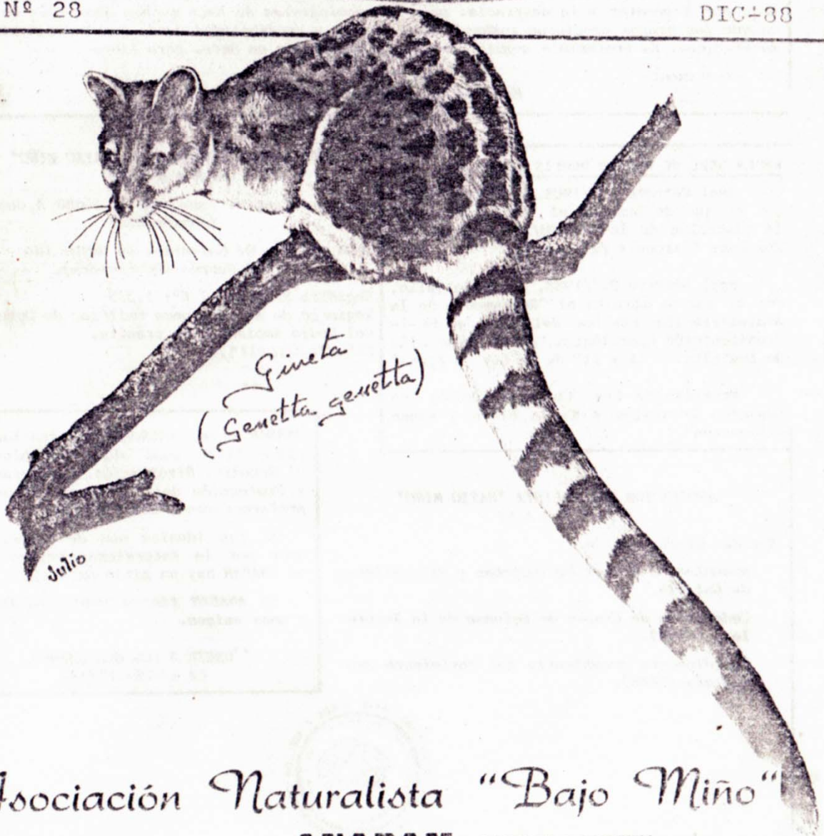
Geneta (Genetta genetta)